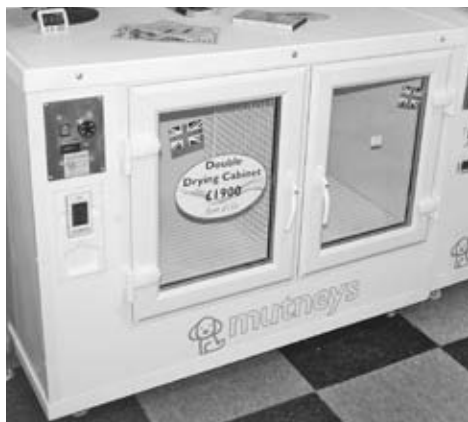
Nepostradatelná výbava britských chovatelů: sušička na psy za pouhých 1908 liber

Ke zvláštnostem Crufts patří i to, že pes nemůže opustit výstavu před 16. hodinou. V reálu jsme zjistili, pokud alespoň trochu chceme vidět i ostatní haly, tak dřívější odchod stejně nepřichází v úvahu. Výstava je i velkou společenskou událostí, vystavovatelé jsou z valně většiny v kostýmech a oblecích. Atmosféra je velmi přátelská, vzhledem k tomu, že se místní vystavovatelé většinou znají, tak „exotičtí“ návštěvníci zpoza kanálu musejí počítat s tím, že budou centrem pozornosti. Na Bugsyho se přijeli podívat budoucí majitelé jeho potomka až z Irska a velmi rychle se s ním spřátelili. Výstavu ke své prezentaci využívaly i jednotlivé chovatelské kluby. Leonberger Club of Great Britain měl svůj stánek přímo v kruhu, kde prodávali klubové suvenýry a také nové vydání knihy Leon-